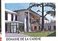
DOMAINE DE LA CADÈNE

Plus de renseignements sur : www.plateforme.domainedelacadene.fr