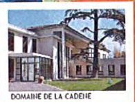
DOMAINE DE LA CADÈNE

PLATEFORME D'ACCOMPAGNEMENT ET DE RÉPIT DES AIDANTS DOMAINE DE LA CADÈNE